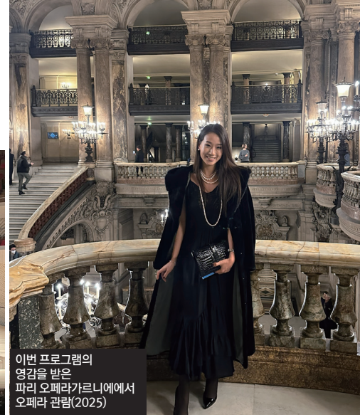
이번 프로그램의 영감을 받은 파리 오페라가르니에에서 오페라 관람(2025)