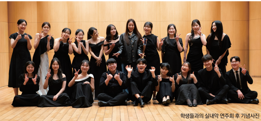
학생들과의 실내악 연주회 후 기념사진