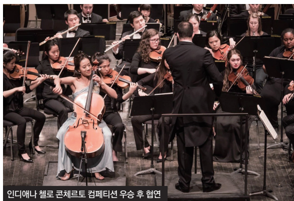
인디애나 첼로 콘체르토 컴페티션 우승 후 협연