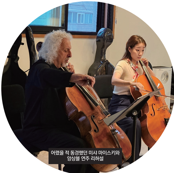
어렸을 적 동경했던 미사 마이크와 앙상을 연주 리허설

오랜 시간 다양한 경험과 실패와 도전, 그리고 사랑하는 마음이 쌓인 음악, 제가 음악 속에 담고 싶은 것은 거창한 메시지라기보다, 말로는 표현하기 어려운 감정의 결, 그리고 고요한 침묵 속에서 전해지는 사랑과 위로입니다. 음악은 모든 것을 말해 주지 않죠. 오히려 말하지 않는 부분에서 더 많은 것이 전해질 수 있다고 믿어요.