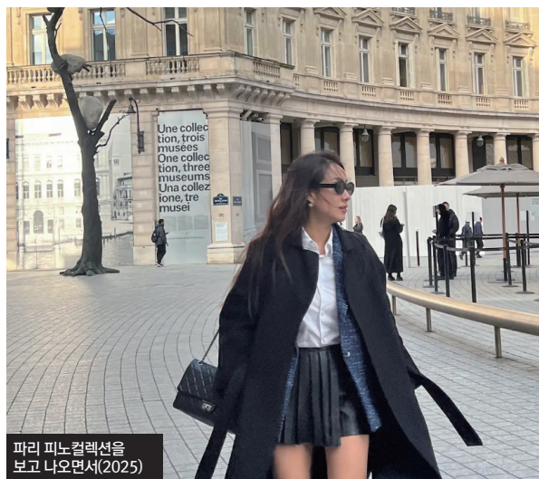
파리 피노컬렉션을 보고 나오면서(2025)

평소 프랑스 음악과 문화를 무척 좋아하는데, 때마침 올해가 한달 수교 140주년이라는 역사적인 의미를 지닌 해여서, 이번 독주회를 기획하는데 중요한 출발점이 되었습니다. 우리나라와 프랑스 수교 140년을 축하하고 기리고 싶은 의미도 있지만 무엇보다 이번 무대를 통해 프랑스 음악